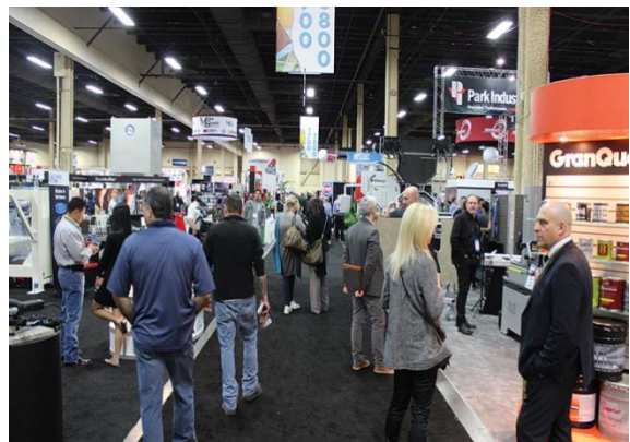
▶ 2018 미국 TISE 사진