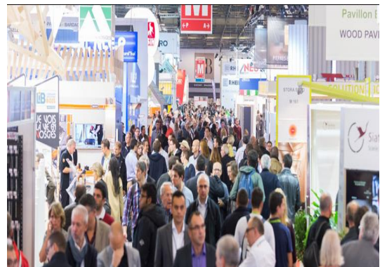
▲ 2017년 프랑스 파리 국제건축박람회 사진