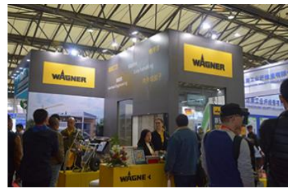
▲ 2017년 World of Concrete Asia 사진