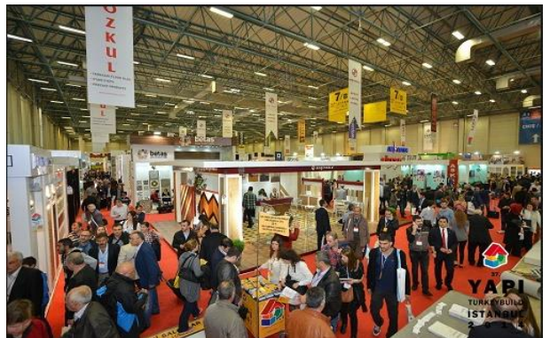
▲ 2017년 터키 건축 박람회 사진