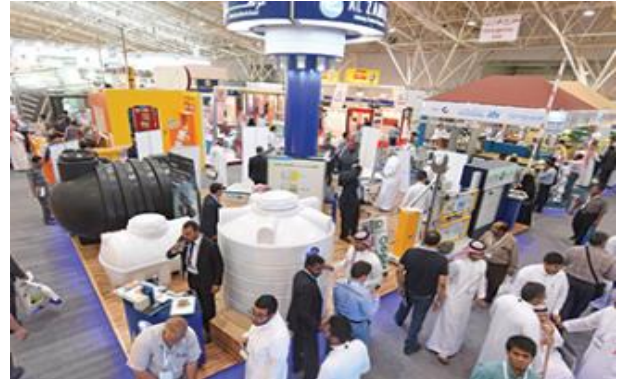
▲ 2017년 Saudi Build 사진