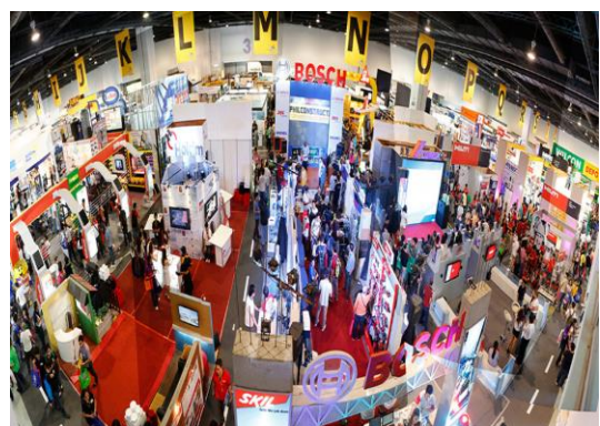
▲ 2018년 1월 Philconstruct 사진