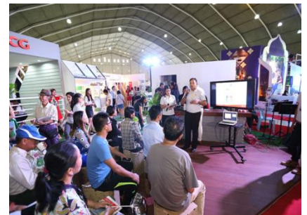
▲ 2017년 Myanmar Build & Decor 사진