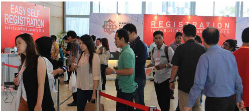
▲ 2016년 IndoBuildTech 사진