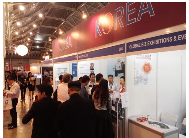
▲ 싱가포르 국제 건축 및 건설기술 한국관 사진