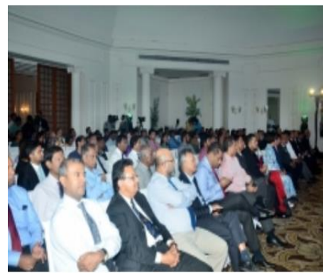
▲ 2017년 스리랑카 Build SI 사진