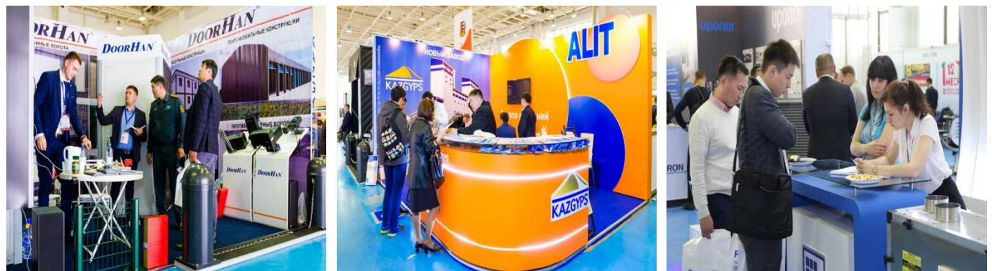
▲ 2017년 아스타나 국제건축박람회 사진